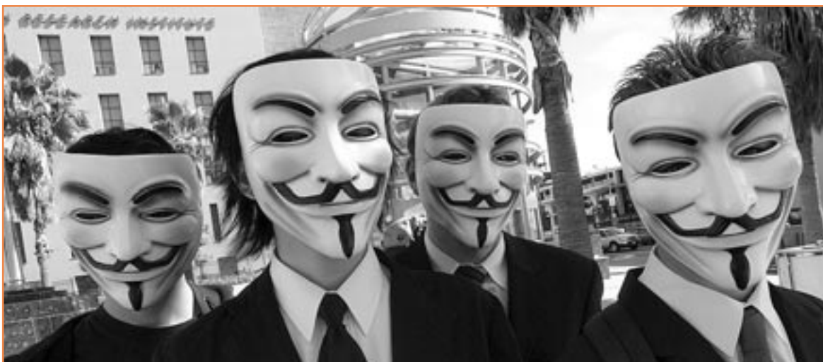
La maschera di Anonymous, indossata dagli "indignados" di tutto il mondo come metafora dell'attacco al sistema

cati senza regole e consumatori senza protezioni», se persino il neopresidente della Banca Centrale Europea, Mario Draghi, riconosce fondate le ragioni degli "indignados", vuol dire che i tempi sono maturi perché, come avvenne ieri per il "socialismo reale", può oggi accadere che questo capitalismo, anch'esso tristemente "reale", sia superato. Ma perché possa verificarsi un simile evento, duramente avversato dai "santuari" dell'economia capitalista, occorre che la politica, o almeno la parte migliore di essa, sappia ascoltare, riflettere e mettere in cantiere proposte e scelte incisivamente innovative.